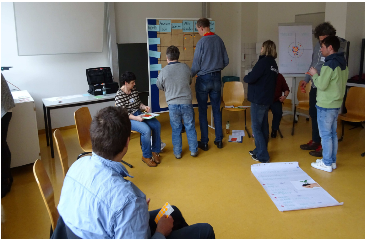
Die Teilnehmenden in einer Arbeitsgruppe

In den Arbeits-Gruppen haben wir genau nachgefragt, in welchen Bereichen im Leben den Teilnehmern Teilhabe wichtig ist.